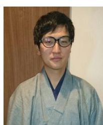
前座 春雨や 晴太