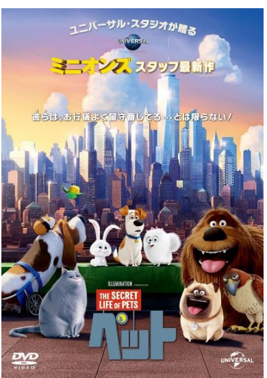
(C) 2015 Universal Studios. All Rights Reserved.

第2部：ファンタスティック・ビーストと魔法使いの旅 日本語吹き替え (133分) 開場：13:00 上映：13:30~15:45 ★先着 230名