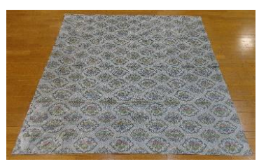
貸出用シート (4.5帖) 4枚