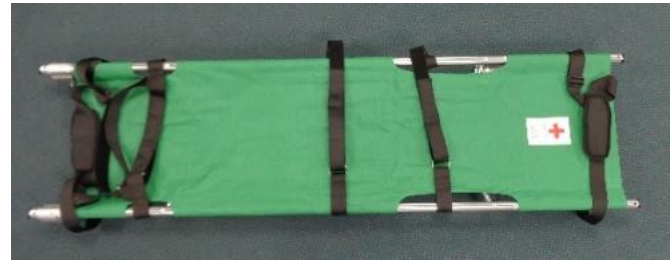
ワンマンストレッチャー 1台