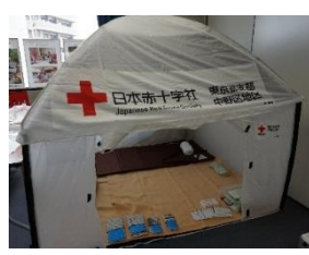
室内用テント (2人用) 3個