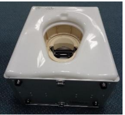
ポータブルトイレ (組立式) 2台