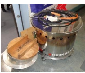
炊き出し釜セット 1個