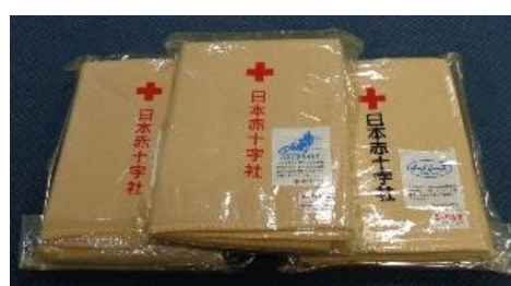
毛布・圧縮型毛布